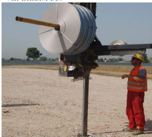
▲ Dettaglio dispositivo di installazione dei dreni