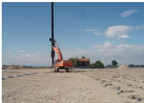
▲ Fase esecuzione dreni