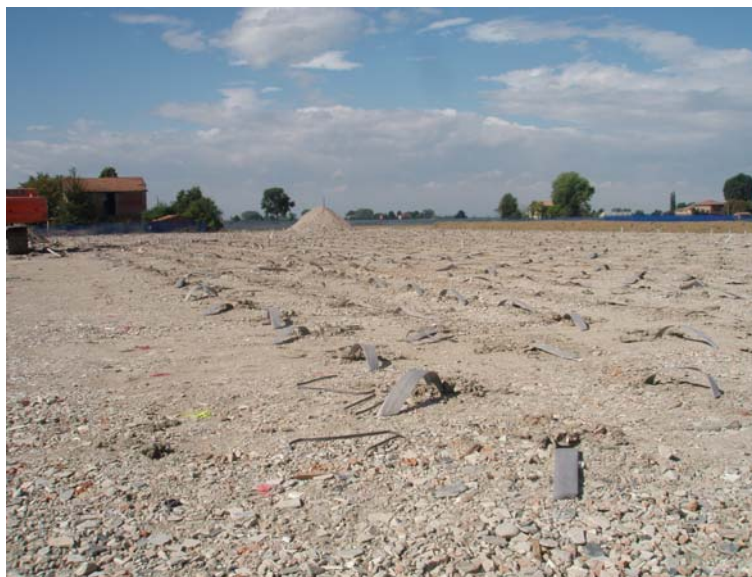
▲ Panoramica di cantiere dopo l'esecuzione dei dreni

Committente : G.S.E. srl (MI) Esecuzione : 2007