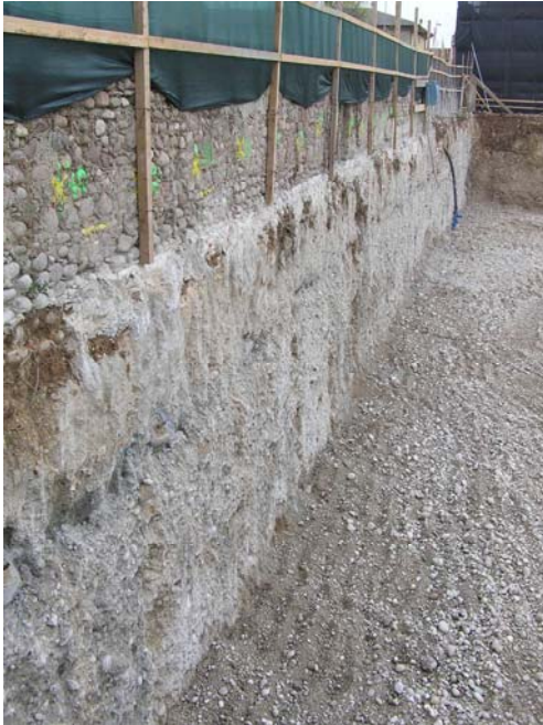
▲ Parete di contenimento scavo, in sottofondazione ad una muratura di confine

Esecuzione di 3.500 mq di pareti faccia a vista di contenimento dello scavo, a mezzo tecnologia SOILCRETE Jet-Grouting ed Ancoraggi di tipo provvisorio da 300 ÷ 450 kN