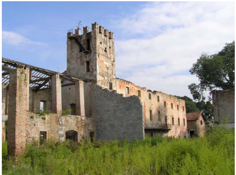
▲ Vista della torre e dei fabbricati prima dell' intervento di consolidamento

Löwecenter Via Isarco, 1 / Eisackstraße, 1 I-39040 Varna / Bressanone (BZ) I-39040 Vahrn / Brixen (BZ) Tel. (0472) 20 19 09 Fax (0472) 20 19 14 E-mail g.schafferer@kellergrundbau.at