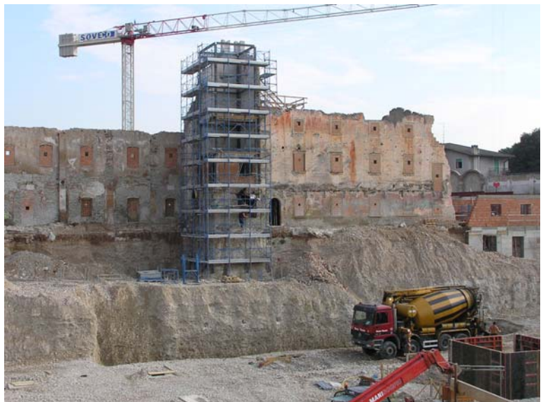
▲ Consolidamento e messa in sicurezza della torre e del fabbricato esistente