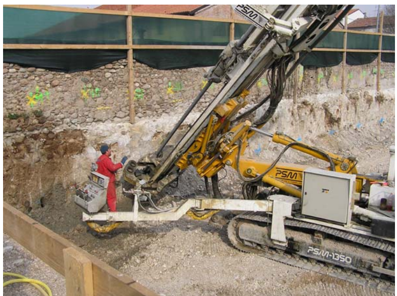
▲ Fase di realizzazione degli ancoraggi provvisori