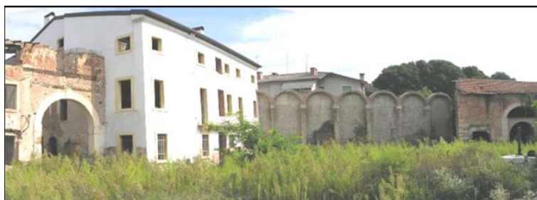
▲ Panoramica dei fabbricati e dei manufatti prima dell'esecuzione dell'intervento di consolidamento con il sistema Soilcrete Jet-Grouting.

Il progetto per la realizzazione del nuovo Complesso Immobiliare Calzedonia S.p.A. prevedeva la realizzazione di diversi vani interrati su più livelli, con quote di fondo scavo variabili tra -4,50 e -8,30 m dal piano di lavoro, a distanza ravvicinata dai fabbricati e manufatti esistenti di un antico rustico.