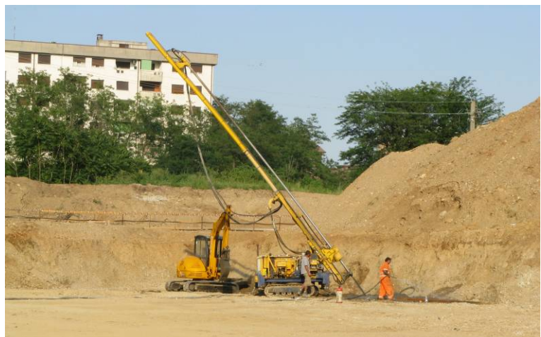
▲ Panoramica di cantiere ad inizio lavori

Committente : Interedil S.r.l. Progettista : Ufficio tecnico Keller Esecuzione : 2009