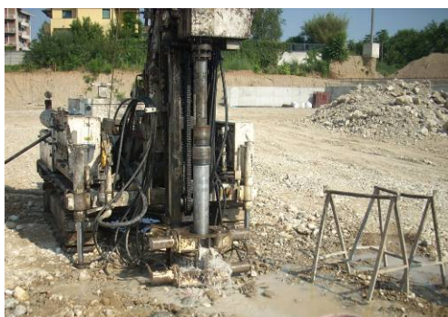
▲ Esecuzione carotaggi