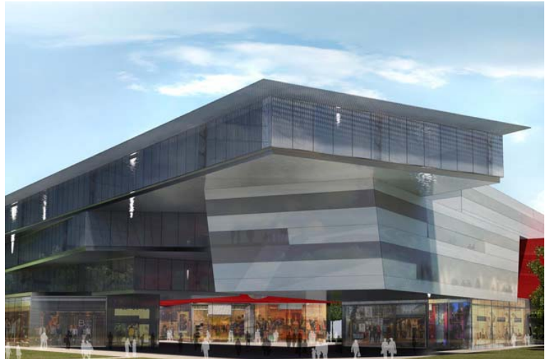
▲ Rendering dell'edificio a termine costruzione

Esecuzione di circa 380 colonne SOILCRETE Jet-Grouting al di sotto di 107 plinti di fondazione e 3 platee.