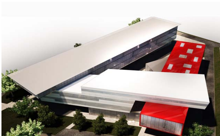
▲ Rendering 3d del progetto

L'Alta Pianura Lombarda è caratterizzata dalla presenza di sprofondamenti che si generano improvvisamente sia in aree rurali che in aree urbane. Questi sprofondamenti, chiamati localmente "occhi pollini", rappresentano in realtà solo l'ultima fase di una più estesa erosione sotterranea che può creare seri danni a infrastrutture di diverso tipo.