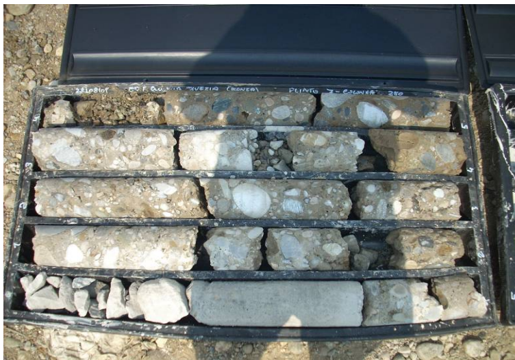
▲ Carotaggio colonna Soilcrete Jet-Grouting

Löwecenter Via Isarco, 1 / Eisackstraße, 1 I-39040 Varna / Bressanone (BZ) I-39040 Vahrn / Brixen (BZ) Tel. +39 0472 201909 Fax +39 0472 201914 E-mail office.brixen@keller-fondazioni.com