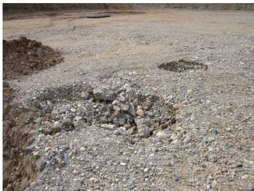
▲ Sprofondamenti del terreno puntuali dovuti alla presenza di "occhi pollini"