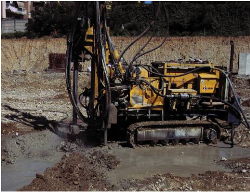
▲ Esecuzione delle colonne Soilcrete Jet-Grouting

Opere di consolidamento dei plinti di fondazione di un edificio commerciale con colonne SOILCRETE Jet-Grouting