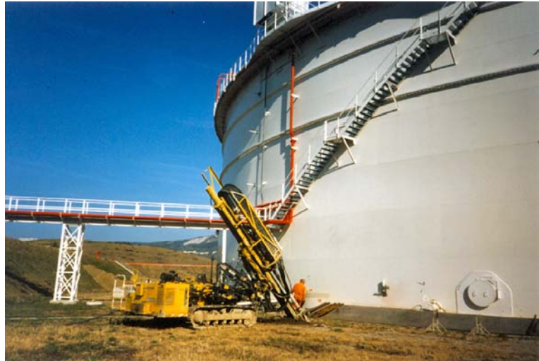
▲ Panoramica durante l'intervento

Trattamento preliminare del terreno esterno all'area di cedimento per incrementare i parametri geomeccanici (prestressing)