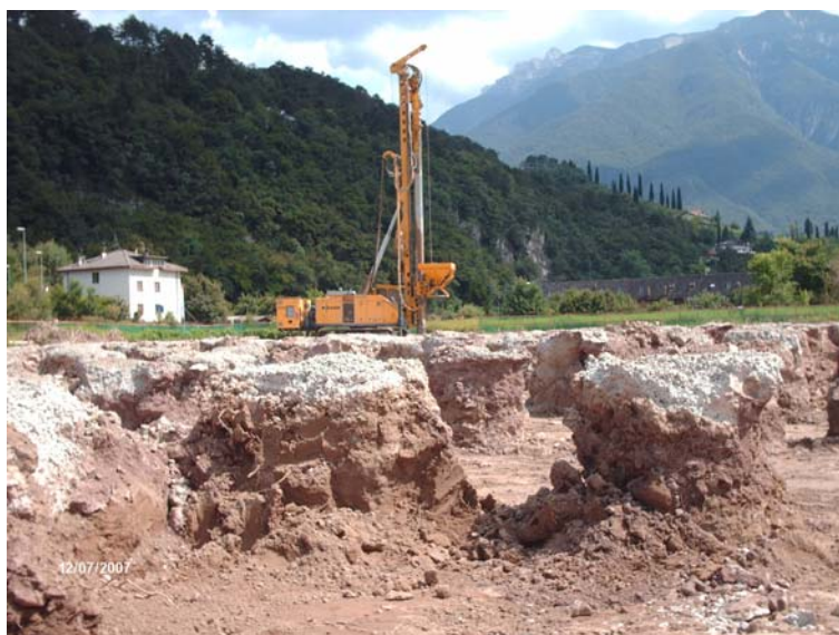
▲ Esecuzione delle colonne CGVC. In primo piano la “testa” delle colonne scoperta.

Tutto ciò ha consentito alla Committenza di risparmiare sul tempo di esecuzione.