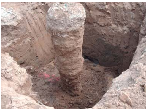
▲ Colonna messa a nudo

Esecuzione di 1046 colonne in ghiaia vibrocompattate cementate, su di un'area di circa 5200 mq.