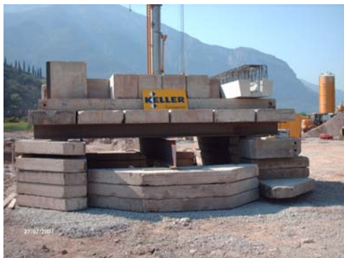
▲ Esecuzione prova di carico di collaudo

Opere di fondazione realizzate con colonne di ghiaia vibro compattate cementate (CGVC)