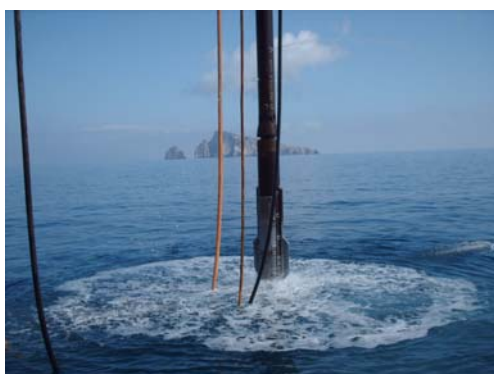
▲ Esecuzione delle colonne vibroflottate

Committente : Codra Mediterranea S.r.l. Esecuzione : 2008