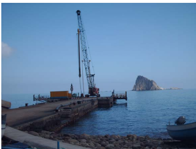
▲ Panoramica di cantiere

Löwecenter Via Isarco, 1 / Eisackstraße, 1 I-39040 Varna / Bressanone (BZ) I-39040 Vahrn / Brixen (BZ) Tel. +39 0472 201909 Fax +39 0472 201914 E-mail office.brixen@keller-fondazioni.com