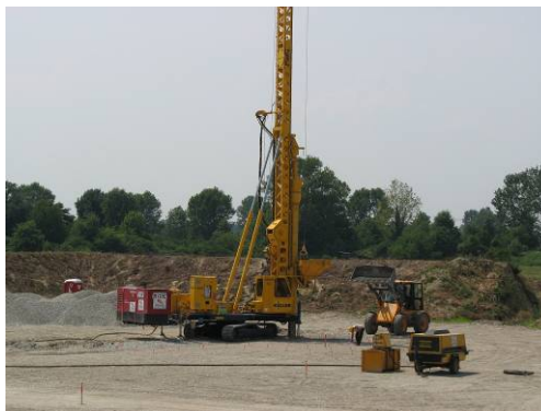
▲ Esecuzione colonne

E' prevista una futura estensione dell'intervento per l'area camino.