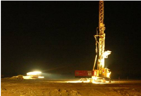
▲ Operatività notturna