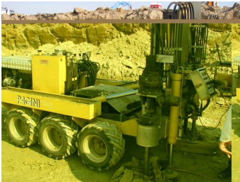
▲ Esecuzione prove penetrometriche di controllo

Committente : Ansaldo Energia Progettista : Studio Garassino (MI) Esecuzione : 2008