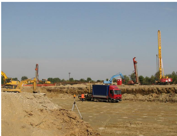
▲ Panoramica di cantiere