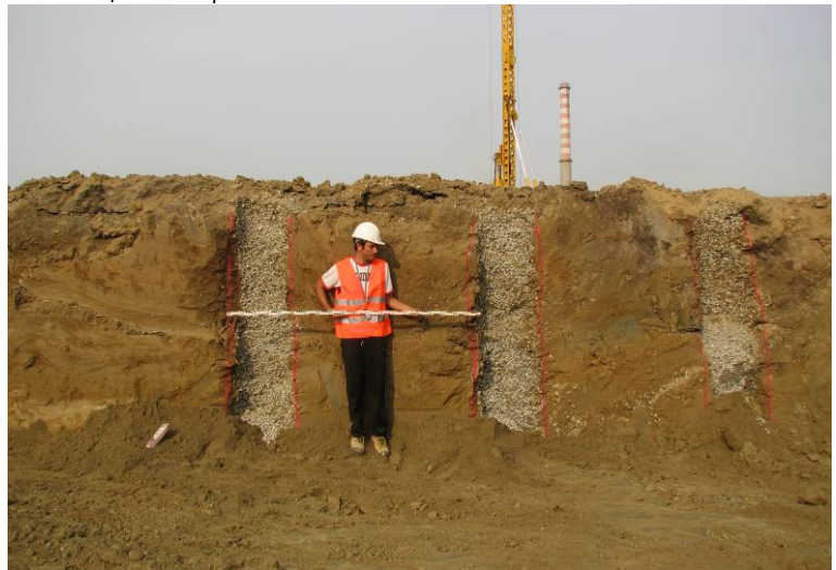
▲ Colonne parzialmente sezionate