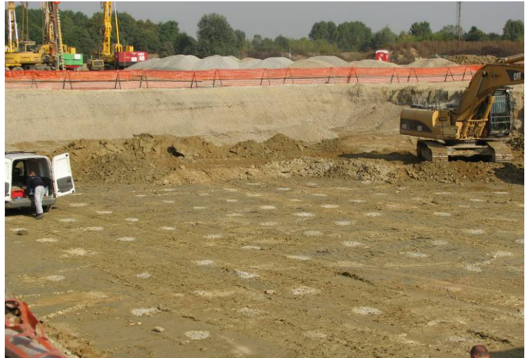
▲ Piano di fondazione post esecuzione colonne CGV

Löwecenter Via Isarco, 1 / Eisackstraße, 1 I-39040 Varna / Bressanone (BZ) I-39040 Vahrn / Brixen (BZ) Tel. +39 0472 201909 Fax +39 0472 201914 E-mail office.brixen@keller-fondazioni.com