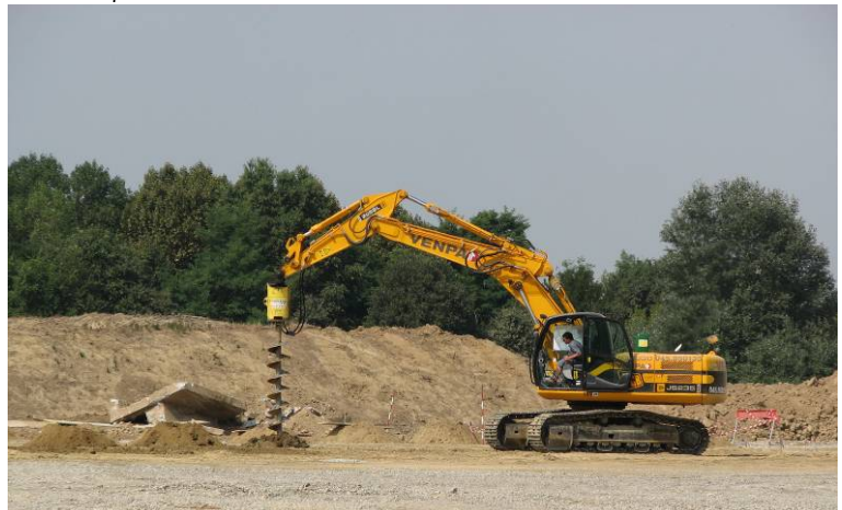
▲ Esecuzione preforni superficiali