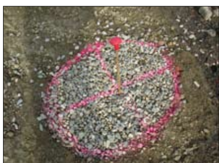
Testa colonna post-rifilatura

menti; l'incremento della resistenza al taglio del sistema colonne-terreno e, quindi, l'incremento dei fattori di sicurezza nei confronti di fenomeni di rottura per capacità portante; l'introduzione nel terreno di elementi drenanti in grado di garantire la rapida dissipazione delle sovrappressioni interstiziali indotte dai carichi o da fenomeni dinamici/sismici.