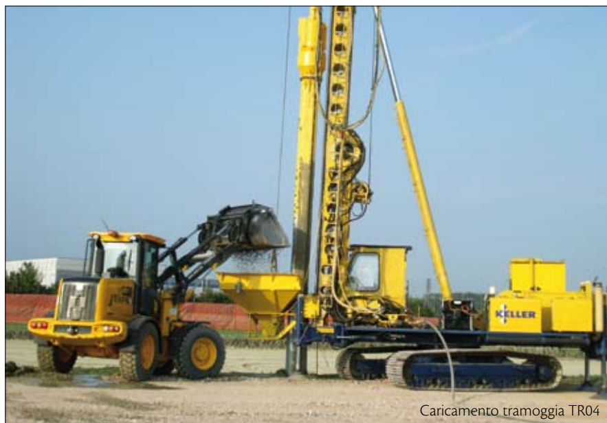
Caricamento tramoggia TR04

Tecnicamente la formazione di elementi colonnari in ghiaia altamente addensati e la contestuale compattazione per scostamento laterale del terreno garantiscono: la riduzione e omogeneizzazione dei cedi-