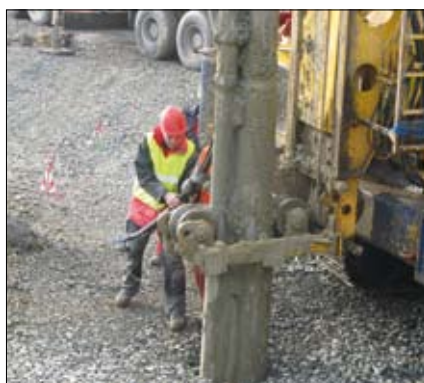
Inserimento sonde geotermiche

Relativamente a questa tecnologia, numerose sono le esperienze Keller in Italia e nel mondo nel campo delle opere portuali. La vibroflottazione è stata adottata per ad-