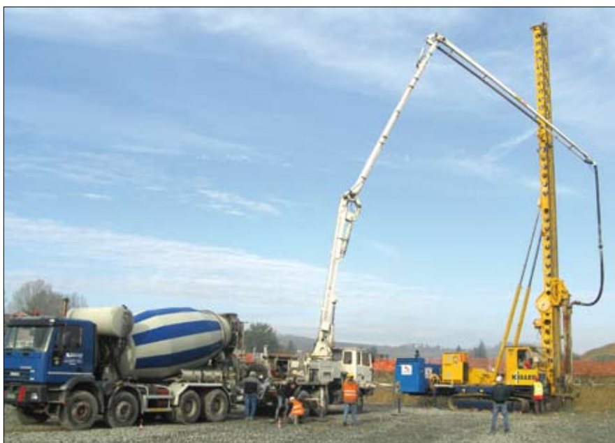
Esecuzione colonne vibrato cls

Recentemente Keller ha iniziato anche a realizzare interventi di valorizzazione delle opere di fondazione collegate al settore della geotermia. Gli elementi colonnari, realizzati in calcestruzzo, sono stati a tale