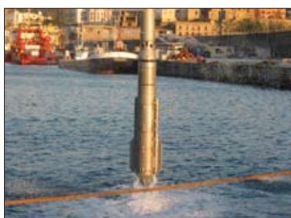
Vibroflottazione a mare

densare i materiali riversati a mare per vasche di colmata, a tergo di palancolati per nuove banchine e per addensare i fondali su cui sono stati poggiati cassoni autoaffondanti finalizzati a realizzare nuovi moli.