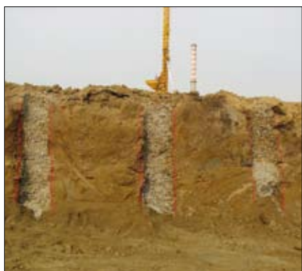
Colonne prova sezionate